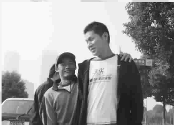
快乐的笑容洋溢在我们每个人的脸上