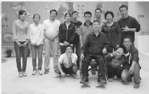
博爱社成员和万家帮庇护所学员的默契互动