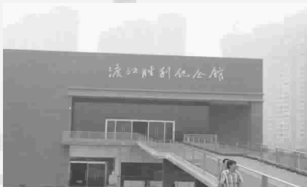
感受生活，参观历史纪念馆