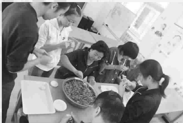
7、2011年9月10日为红山街道残疾人托养中心送中秋祝福