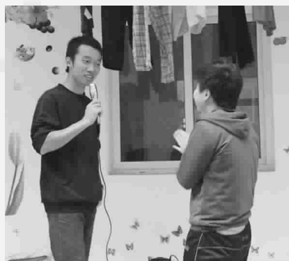
博爱社成员和万家帮庇护所学员的默契互动