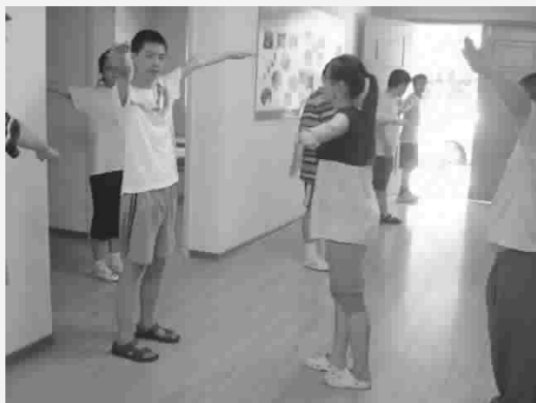
利用我们所学的基本知识，帮助他们恢复身体机能。