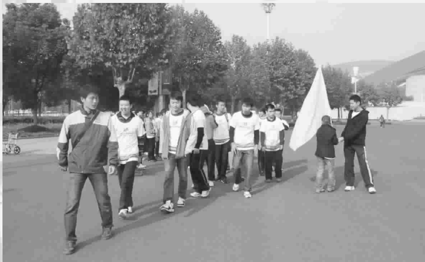
活动开始前大家有序的排队做准备