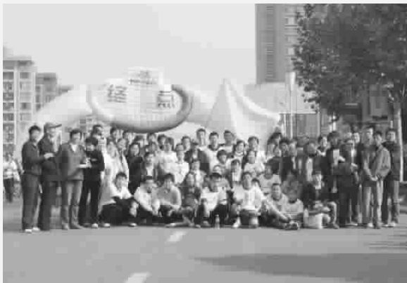
健康跑在大家的齐心努力下圆满完成,在终点一起合照留念,记录下这感动的一瞬间!